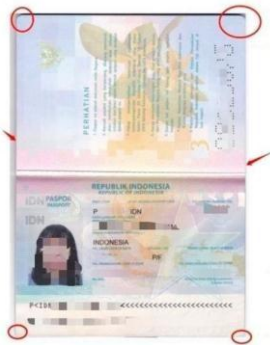
Contoh Scan Passport: